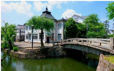
倉敷美観地区(イメージ)

☆世界遺産宮島と厳島神社、広島平和記念公園、尾道、日本三名園のひとつ後樂園など山陽の名所をめぐる。 ☆日本画と庭園が有名な足立美術館、水木しげるロード、国宝松江城、出雲大社など山陰の人気の観光地を訪ねます。