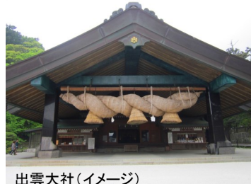
出雲大社(イメージ)