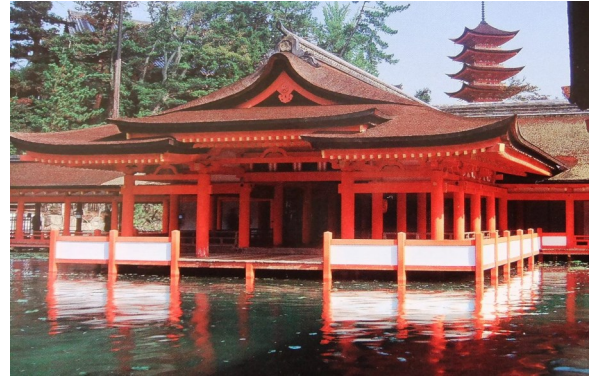
世界遺産 厳島神社(イメージ)

☆世界遺産宮島と厳島神社、広島平和記念公園、尾道、日本三名園のひとつ後樂園など山陽の名所をめぐる。 ☆日本画と庭園が有名な足立美術館、水木しげるロード、国宝松江城、出雲大社など山陰の人気の観光地を訪ねます。