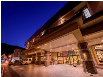
ホテル外観 (イメージ)