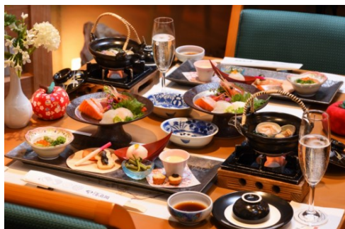
夕食はハーフビュッフェ (イメージ)