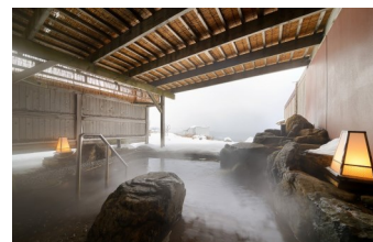
露天風呂 (イメージ)