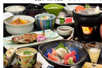
夕食のお料理 (イメージ)