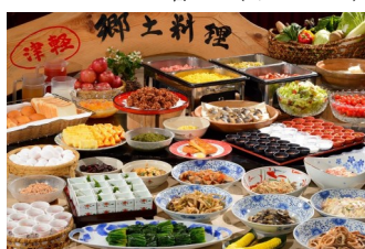
朝食バイキング (イメージ)