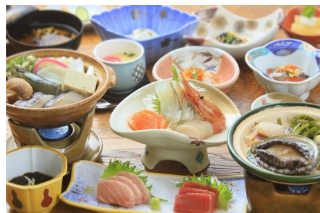
あわびと帆立の陶板焼付夕食 (イメージ)

下北の海の旬の食材を使用したお料理をご賞味ください。夕食には地元産のあわびと帆立を陶板焼きでご提供いたします。名湯下風呂温泉の源泉かけ流しの硫黄泉でお客様の体と心を芯まで温めて癒やします。