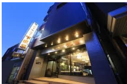
ホテル外観 (イメージ)