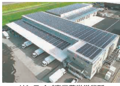
サンライズ産業花巻営業所