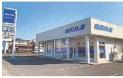
八戸市長苗代に開設した 県民共済八戸センター