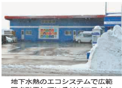
地下水熱のエコシステムで広範囲を融雪しているリビエラ本社