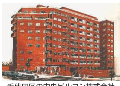
千代田区の中央ビルコン株式会社