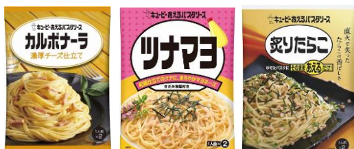
【あえるパスタソースシリーズ】