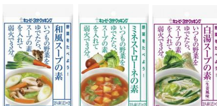
【スープの素シリーズ】