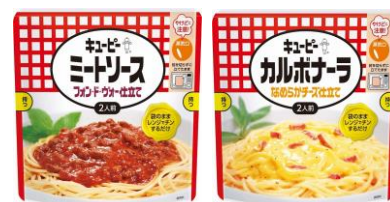
【キューピーパスタソースシリーズ】