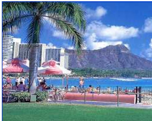
ハイアットリージェンシーホテル（イメージ）