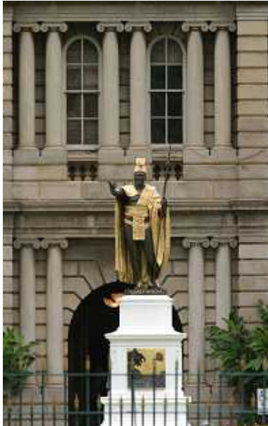
カメハメハ大王(イメージ)