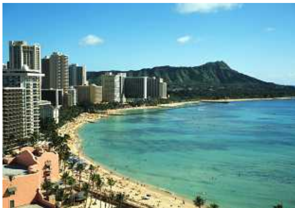
ワイキキビーチ(イメージ)